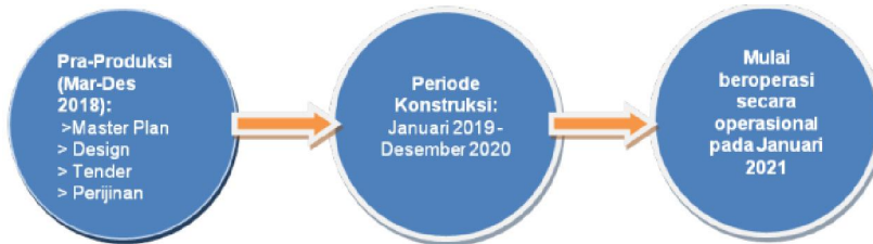
Gambar Master Plan Movie Land

Saat ini MIR sedang dalam tahap penyelesaian master plan untuk movie land . Dengan luas lahan movie land sebesar 21 hektar, MIR merencanakan akan membagi pembangunan ke dalam 2 tahap yakni pembangunan tahap 1 seluas 10 hektar dan sisanya akan dilanjutkan di pembangunan tahap 2. Perseroan membagi rencana pembangunan movie land tahap 1 dalam 3 fase, yaitu: